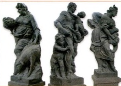
barokní sochy ctností a neřesti

📌 M. B. Braun v hospitálu Kuks vytvořil sochy představující ctnosti a neřesti. Na fotografiích určete Lásku, Štědrosť a Obžerství. Jak se tyto ctnosti a neřest projevují?