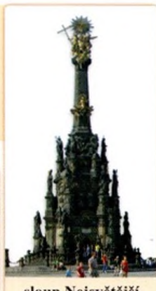
sloup Nejsvětější Trojice v Olomouci