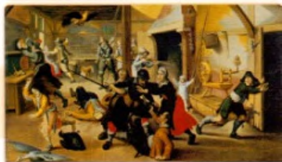
žoldnéři rabující usedlost