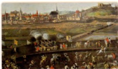
obléhání Brna Švédy